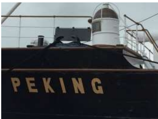
Der Backbord „Leuchtturm“ auf der Back (=der Gegen Seechlag schützende Turm für die Petroleum-Positionslampe)

Im Folgenden gebe ich euch ein paar Impressionen