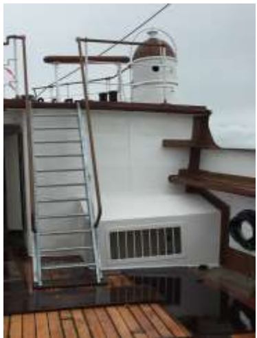
Die Stb Schweinehocke an der Achterkante der Back; oben auf Der Back der Stb-„Leuchtturm“ Für die Positionslaterne