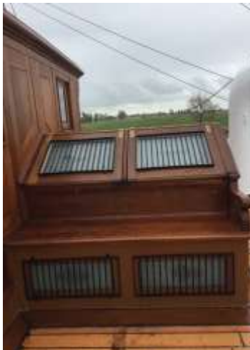
Achterkante Kartenhaus mit dem restaurierten Skylight für den Kapitänssalon darunter