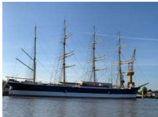
PEKING komplett geriggt vom gegenüberliegenden Ufer