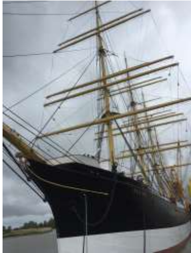
PEKING an der Werftpier