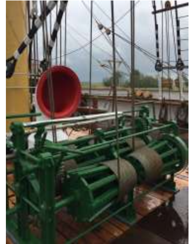
eine Brasswinde oder Jarviswinde mit so einer Winde wurden die untersten 3 Rahen eines Mastes zugleich gebrasst