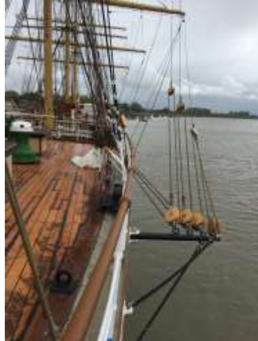
der Steuerbord Brassbaum Blick von der Poop nach vorn