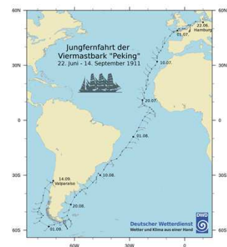
Unten: Reiseroute der Jungfernfahrt der „Peking“ rund um Kap Hoorn nach Valparaiso.

Heute befinden sich die meteorologischen Journale aus den Beständen der Deutschen Seewarte im Archiv des DWD im Seewetteramt Hamburg. Die Journale stammen aus der Zeit von 1868 bis 1939 und sind mittlerweile von großem Wert für die Klimaforschung. Sie werden derzeit digitalisiert, um sie auf elektronischem Wege auswerten zu können. Die historischen Aufzeichnungen ermöglichen der Klimaforschung, die Wetter- und Klimaverhältnisse auf den Ozeanen und bis weit in das 19. Jahrhundert zurück zu rekonstruieren und zu analysieren.